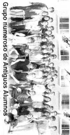
Grupo numeroso de Antiguos Alumnos recientes, que vinieron a por el chupón