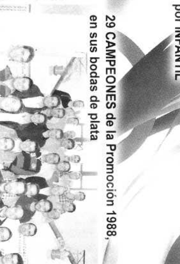
29 CAMPEONES de la Promoción 1988, en sus bodas de plata