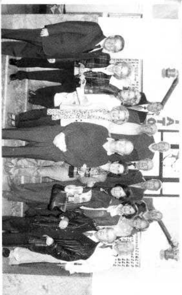
Grupo de la Promoción de 1963, en sus