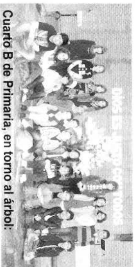
Cuarto B de Primaria, en torno al árbol: “VIATOR... semilla que Querbes nombró”