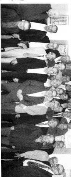
Bodas de oro.